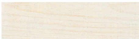
Nr. 2 weiß