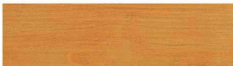
Nr. 4 zeder