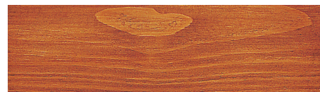
Nr. 6 teak