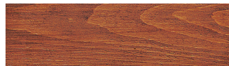
Nr. 7 palisander