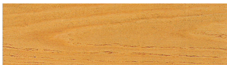
Nr. 3 kiefer