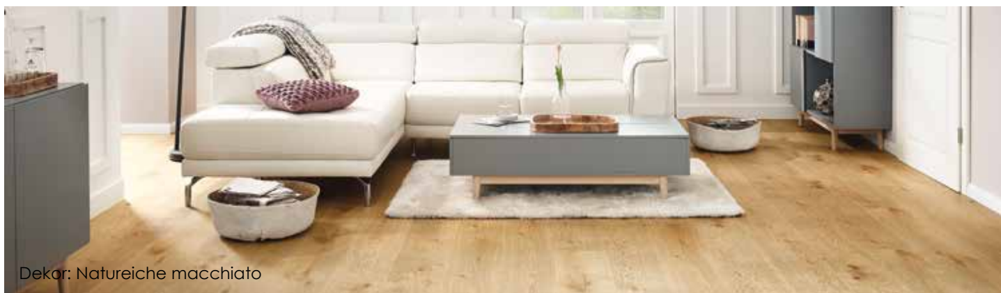
Dekor: Natureiche macchiato