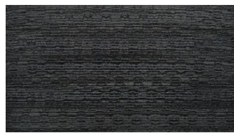
Dunkelgrau massiv gebürstet