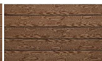
Hellbraun massiv struktur