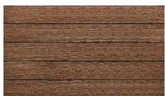
Hellbraun massiv gebürstet