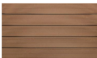
Hellbraun massiv genutet