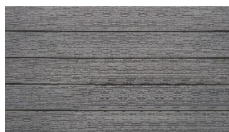
Hellgrau massiv gebürstet