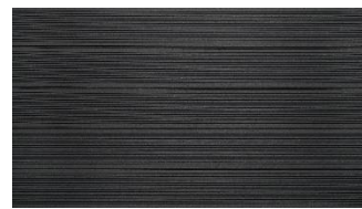
Dunkelgrau massiv gerillt