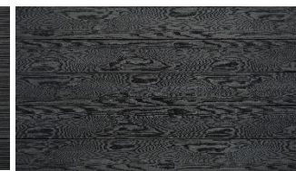
Dunkelgrau massiv struktur

Das Naturprodukt Holz ist einzigartig in seiner Form und Beschaffenheit. Struktur- und Farbunterschiede unterstreichen seine Individualität und stellen keinen Mangel dar. Mit unserer langjährigen Erfahrung und der Liebe zum Holz sind wir stets bestrebt Ihnen ein einwandfreies Produkt zu liefern. Gänzlich können wir vereinzelte Sortier- und Produktionsfehler nicht ausschließen, welche jedoch 5% der Liefermenge nicht überschreiten.