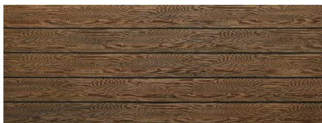
Thermoeiche (Optik) struktur