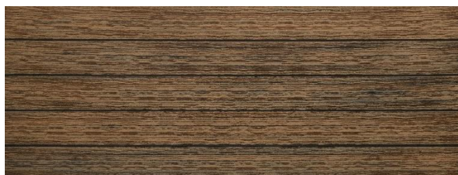
Thermoeiche (Optik) gebürstet