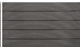
Hellgrau massiv genutet