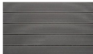
Hellgrau massiv gerillt