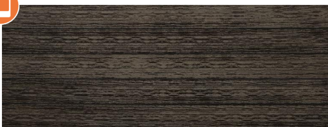
Thermoesche (Optik) gebürstet