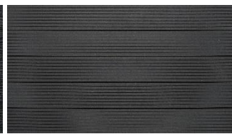
Dunkelgrau massiv genutet