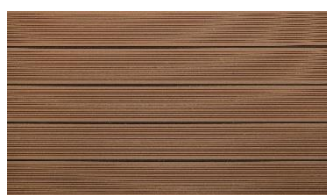
Hellbraun massiv gerillt