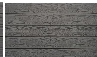
Hellgrau massiv struktur