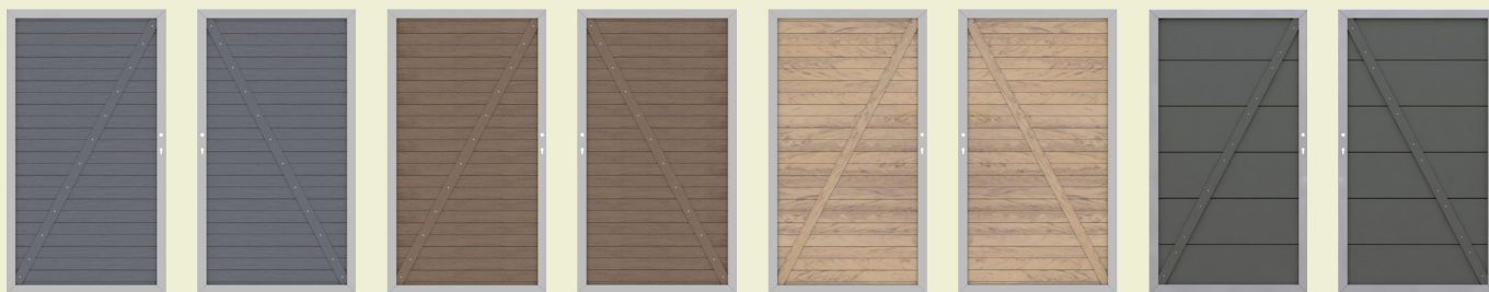
Art 2137 DIN li*

Maße: je 98 x 179 cm; inklusive Beschlagsatz und Einsteckschloss